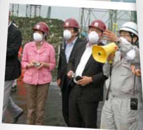
石巻市の震災がれきの焼却施設を見学