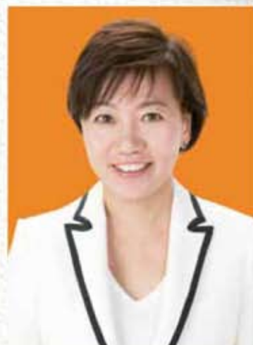
福岡県議会議員 堤 かなめ