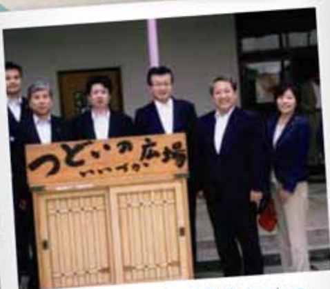
飯塚市の子育て支援事業のひとつ“集いの広場 いいづか”視察