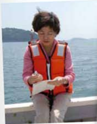
被災地の漁業の復旧状況を視察