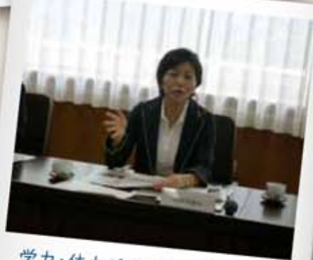
学力・体力が全国トップレベルの福岡県を訪問し、教育施策を調査

皆さまには、日頃よりのご支援、ご指導に心から感謝いたします。 県議として2年目を迎え、活動範囲が徐々に広がってきているように思います。様々な役割も与えていただいています。まずはしっかりとその役目を果たしながら、皆さまの声を政策の立案に反映できるよう頑張っている所存です。真面目に実直に一つ一つの課題に取り組みます。